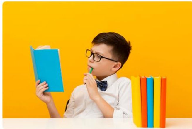
Тест на дисграфию